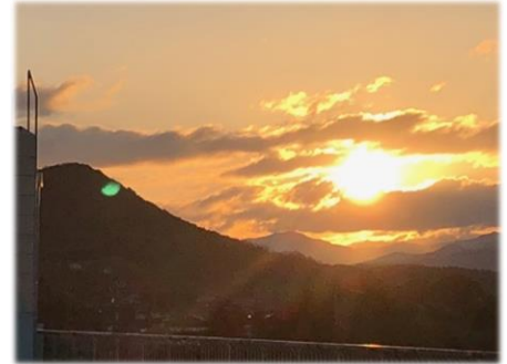
滝宮小屋上からの初日の出

あけましておめでとうございます。 昨年中は本校の教育活動に対し、保護者・地域の皆様には、大変お世話になりました。心よりお礼申し上げます。