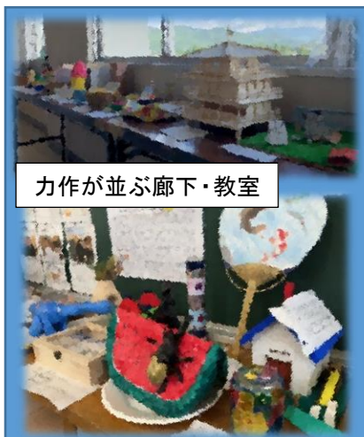
力作が並ぶ廊下・教室

子どもたちが大きな怪我や事故等もなく思い出を残して今日を迎えることができたのも、お家の方・地域の皆様のおかげであると感謝しております。本当にありがとうございます。