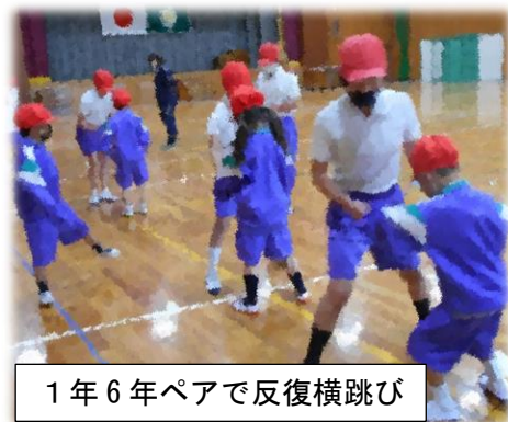
1年6年ペアで反復横跳び