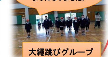
大縄跳びグループ