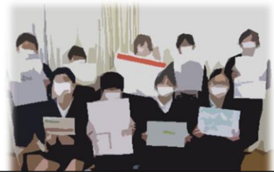
目標を呼びかけた保健委員会

各教室にある二酸化炭素濃度計を存分に活用して、換気の徹底を図ります。新型コロナ感染症やインフルエンザなどの感染症について、子どもたちが主体的に感染予防できる態度が身についてきています。