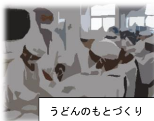
うどんのもとづくり