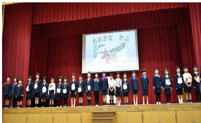
「1年 みんなでぬこう！おおきなかぶ」