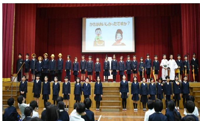
「3年 しょうかいしたい！わたしたちの住む昭和」