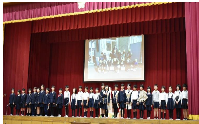
「2年 語りつぐ昔話『かきこじぞう』」