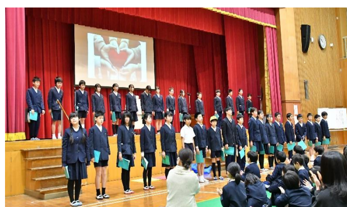
「6年 SDGs ～輝く未来をめざして～」

保護者の皆様、昭和っ子発表会をご観覧いただきありがとうございました。学習したことを発達段階に応じて表現しました。2学期の後半から練習に取り組み、本番まで子ども達は一生懸命に練習に取り組んでいました。