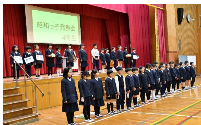
「4年 昭和っ子突破クイズ」