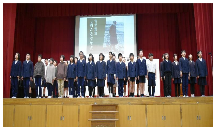
「5年 『注文の多い料理店』～賢治の込めた思い～」