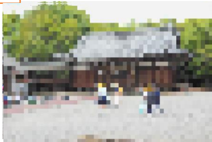
6年 1年と一緒に弁当を食べた後、なかよく一緒に遊びました。