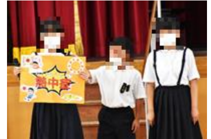
7月12日朝会 健康委員会「熱中書予防」

さて、もうすぐ、子どもたちが楽しみにしている夏休みが始まります。夏休みは、セルフコントロール力を身に付けさせる絶好の期間です。朝決めた時間に起きる、計画的に学習をする、ゲームの時間を守る、決めた家の手伝いをするなど、自分で決めたことを自分で守ることに挑戦してほしいと思っています。これができると、ちょっとした誘惑に負けず、自らの意思で思考や行動を制御できる子に育つのではないかと思います。少しずつこのような力が身に付くようにご家庭でも声掛けをお願いします。