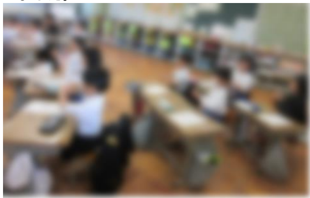
6つのポーズを確認したよ。

「きれいに洗えていたかな」と手洗いチェッカーで確かめると、きれいに洗えていないところもありました。