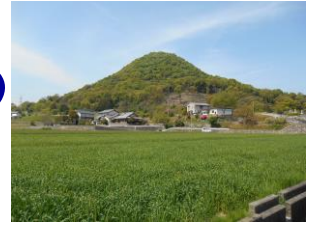
綾川町立羽床小学校