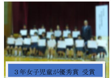
3年女子児童が優秀賞 受賞