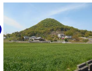
綾川町立羽床小学校