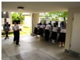
【フェイスウォッシュタイム！】

特に給食の配膳前、給食後の手洗いを徹底します。また、放課後はドアノブやスイッチなど多くの生徒が手に触れる部分を消毒します。