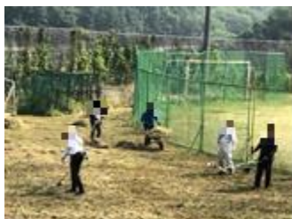
【この人数で刈り上げました】

5月16日(土)に予定されていたPTA奉仕作業でしたが、当日の朝があいにくの天気でしたので、翌日の17日(日)に順延しての実施となりました。有志の保護者と教職員を併せて50名ほどの方々に、運動場西側、校舎東、南運動場西側の草刈りを行いました。ご協力ありがとうございました。今年は毎年行っている場所までの草を刈り取ることができませんでしたが、皆様のご協力ですっぱりとした校庭が蘇りました。6月からの学校再開に向けた準備がまた一つ整いました。