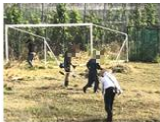
【徐々に草が無くなります】