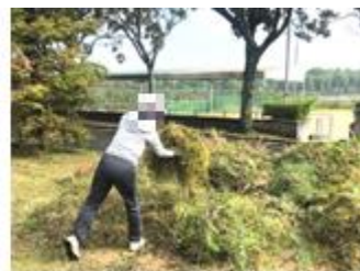
【盛り上げて草を集めます】