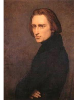
【フランツ・リスト】

先月号では、ピアニストのポリニによるピアノの難曲中の難曲の一つのショパン作曲の「エチュード」を紹介しながら、今の難局を乗り越えるためのヒントを考えました。この曲とは別に、世の中に存在するピアノ曲の中で、多くのピアニストが口をそろえて一番難しいと評する曲があります。「ピアノの魔術師」と呼ばれるハンガリーの作曲家リストによる「パガニーニによる超絶技巧練習曲第3番『ラ・カンパネラ』」です。この「パガニーニによる超絶技巧練習曲」は、当時こんな難しいピアノ曲は誰にも弾きこなせないとのクレームが多かったため、リストが3度も書き直したと言われています。