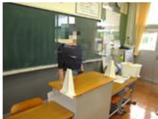
【教卓にパネルを設置】