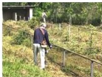
【斜面を丁寧に刈ります】