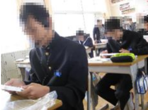
【ヘッドセット装着】

10月17日(木)に、香川県では昨年度から生徒の英語4技能(聞く、話す、読む、書く)をバランスよく育成するため、資格・検定試験(GTEC Speaking Test)を活用した「話す」調査(スピーキングテスト)を2年生で実施しました。一人一人にタブレットパソコンとヘッドセット(ヘッドフォンとマイクのセット)が配られ、それに向かって英語で話して解答をしていきます。最初は緊張していた生徒でしたが、問題が進むにつれて、だんだん声が教室に響くようになりました。「話す」技能は英語の重要な技能の一つです。英語が自由に使えるようになったら、素敵ですよ!近い未来、英語の授業や試験は大きく変わりますよ!