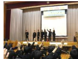
【動画はどうだった?】