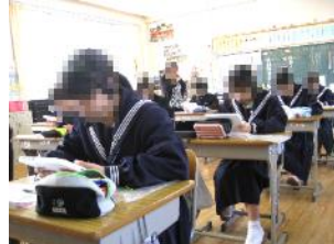
【タブレットは一人1台】