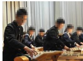
【安定感ある箏合奏】

午後からは、いよいよ合唱コンクールです。1年生から3年生まで、今までの練習の成果を発表しようと、どのクラスからもその意気込みが伝わってきました。