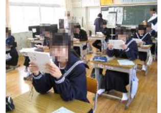
【あちこちから英語が聞こえます】