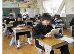
【問題を読む時間は静かです】