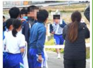
【中間の声援を受けてゴール！】