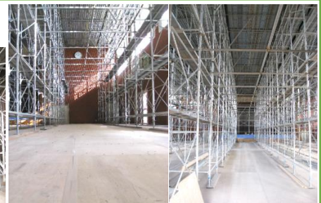
【ステージの足場】 【床一面にコンパネ】 【足場だらけのフロア】