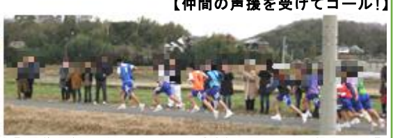
【ゴール目前】【駅伝はタスキを繋ぐ心が大切】 【優勝！】 【まだかな？】 【沿道の保護者の方からの声援を受けて力走です！】