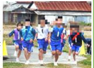
【第一走者一斉にスタート！】