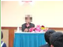
語り部さんの講話

4月11日(火)から14日(金)の3泊4日、沖縄県へ修学旅行に行ってきました。出発式終了後、高松空港が悪天候のため閉鎖ということを知り、急きょ伊丹空港からの出発となりました。そのため、1日目の見学地がひめゆりの塔だけとなりましたが、語り部さんから戦争体験をお聞きし、平和の尊さを改めて痛感しました。2日目からは天候や交通事情に恵まれ、スムーズに行程を進めることができました。2日目の平和の礎で行った平和集会では、『世界の平和』を祈念しての黙祷とともに『さとうきび畑』を全員で歌いました。また、民泊では、農業体験や沖縄料理などの食事づくりなどをさせていただきました。シーサーづくりやマリンスポーツ学習、美ら海水族館、首里城公園、国際通りでの班別学習など、生徒にとって貴重な体験となりました。特に、民泊での東村の方々の温かいおもてなしと体験が、生徒たちの一番の思い出となったようです。生徒たちは、互いに助け合い、協力し合いながらさまざまな日程を無事、終えることができました。添乗員さんからは「お願い事項や集合時間などをきちんと守ってくれる」、運転手さんやバスガイドさんからは「乗降の際のあいさつや、案内の時には耳を傾け聞いてくれる」など、お褒めの言葉をいただくなど、綾上中学校生としてのよい態度や学校生活では見られない顔を随所で見ることができました。多くの思い出をつくることのできた有意義な修学旅行でした。