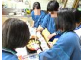
サーターアンダーギーづくりに挑戦