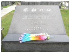
平和の礎にみんなで作った千羽鶴を奉納