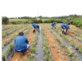
パイナップル畑で農作業のお手伝い