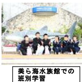
美ら海水族館での班別学習