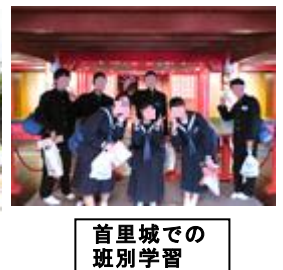
首里城での班別学習