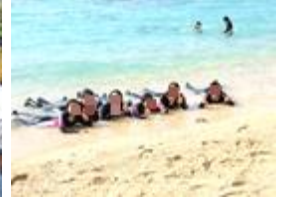
マリンスポーツを満喫中