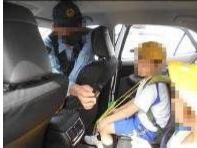
【2年 駐在所・グリーンフィールド・図書館】