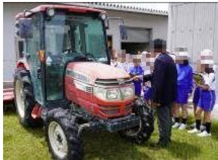
【5年 主基斎田記念館、農業試験場、高山航空公園】