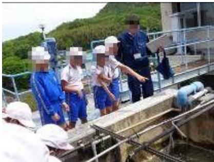
【4年 長柄ダム・綾南浄水場・綾菊酒造】