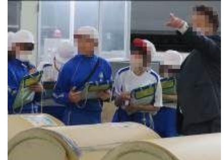
【6年 小松印刷綾川工場、ひだまり公園あやがわ、滝宮こども園】