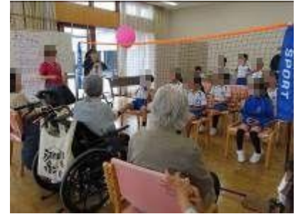
【3年 いきいきセンター・枋所公民館・もみじ温泉】