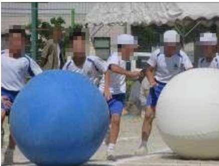
運動会での大玉転がし

6月中旬からは、きずな班で給食を食べる予定です。これからも、心が温かくなる楽しい活動をたくさんしていきます。