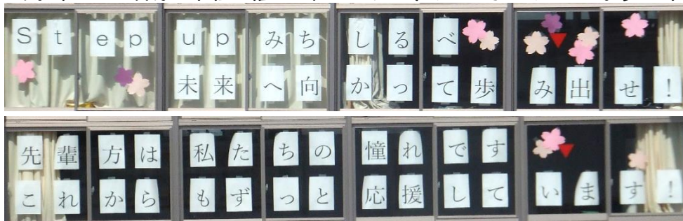
【北校舎3階の窓に掲示された生徒会から3年生へのメッセージ】

明日からの3月10日(火)、11日(水)の2日間で香川県公立高等学校一般選抜(学力検査、適性検査、面接)が行われます。今日は、一般選抜の時間や持ち物の確認をして、早めに寝るようにしましょう。今までの自分の取組を信じて、ベストを尽くしてきてください。夢が叶うことを祈っています。