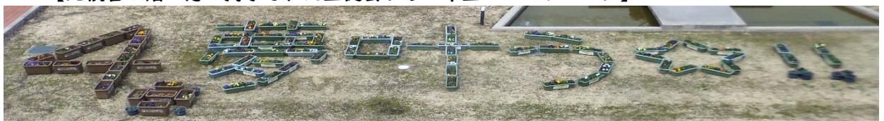
【中庭にプランターでかいた文字 環境委員会からのメッセージ】