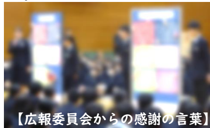
【広報委員会からの感謝の言葉】