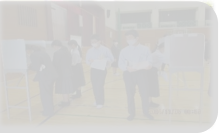
【11月5日(火)生徒会選挙】