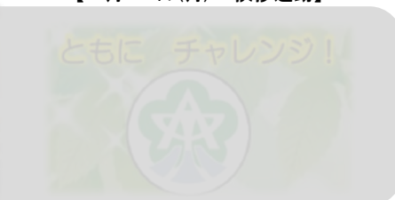
【今までありがとうございました】