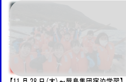
【11月28日(木)～屋島集団宿泊学習】