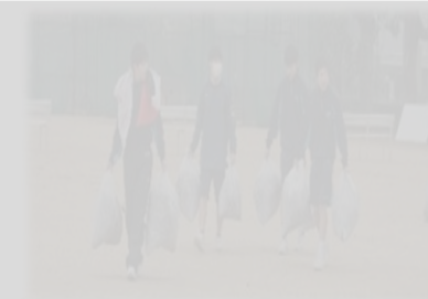
【11月マナーアップリーダーズの活躍】