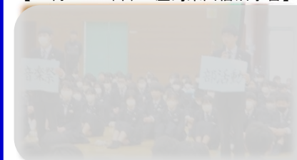
【2月26日(水)3年生を送る会】