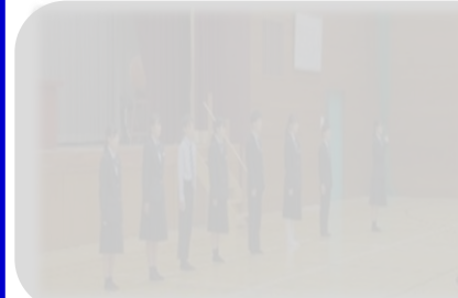
【11月13日(水)生徒会引継ぎ式】