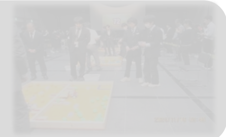
【11月16日(土)ロボコン出場】