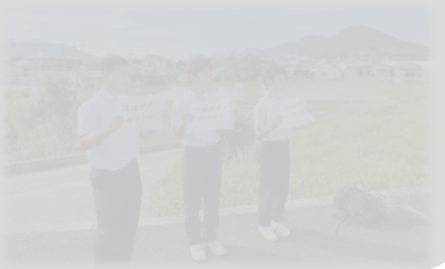
【9月18日(水)交通委員会の取組】