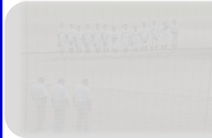
【10月6日(日)都市新人開幕】