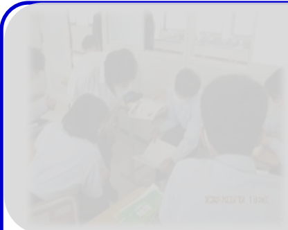
【6月12日(水)教育委員会学校訪問】