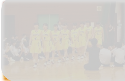
【6月28日(金)大会コケル壮行会】