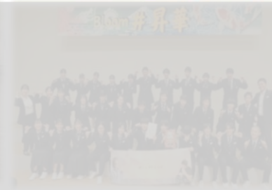
【10月17日(木)校内音楽祭】