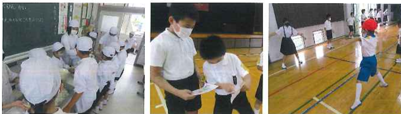
【給食の仕方を教えてもらったよ。】 【自己紹介カードを交換したよ。】 【まねっこ遊び、楽しかったな。】

1年生は、入学してから、掃除の仕方や給食の仕方など優しく教えてくれたり、遊んでくれたりした6年生のことが大好きです。最上級生として、自分ができていることを考えて行動する姿が、全校生のよい手本となりました。