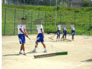
B & G 清掃 草ぬきやグラウンド整備のお手伝いをしました。