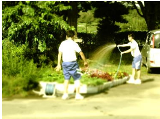
花の水やり 土日の朝夕、校内で育てている花々に水やりをしました。

毎年、行っている「選択ボランティア」を今年も実施しました。暑さが続く中、11の活動に159名が希望し、ボランティアの意義（自主性・社会性・無償性・先駆性など）を地域の方々や事業所の方々に教えていただくとともに、たくさんの方々との出会い、自分がしなければいけないことに気づいたのではないかと思います。このような体験を積み重ねながら「誰かに言われて動く」ではなく、「自分で考え判断して動く」生徒に育ってほしいと思っています。関わってくださったたくさんの方々、ありがとうございました。