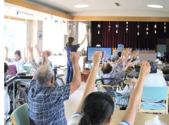
松林荘 折り紙や体操などのレクリエーションと一緒にしました。