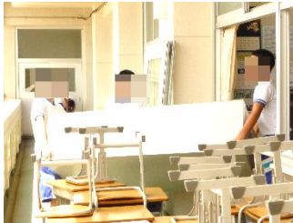
環境整備 校舎内のワックスがけを中心に環境整備をしました。