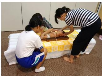
えがお 乳幼児検診のお手伝いと親子とのふれあいをしました。