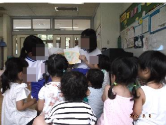
山田保育所 絵本の読み聞かせやプール・外遊びなどのお手伝いをしました。