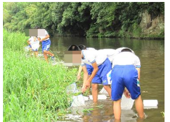
綾川水質調査 水生生物による水質の調査、綾川上流域の清掃をしました。