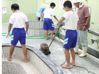
もみじ温泉 お風呂やトイレなど施設内の清掃のお手伝いをしました。