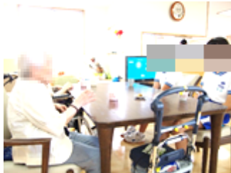
あやがわ デイサービスのお手伝いやゲーム、お話などをしました。