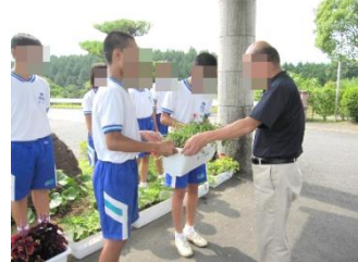
プランターお届け 育てた花を校区内の事業所にお届けしました。