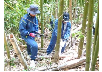
綾川ウッズMC 里山に入り、下草刈や竹刈のお手伝いをしました。